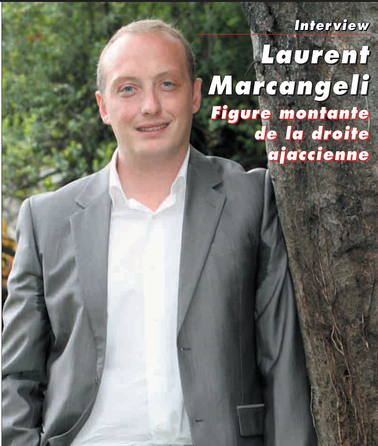
Figure montante de la droite ajaccienne