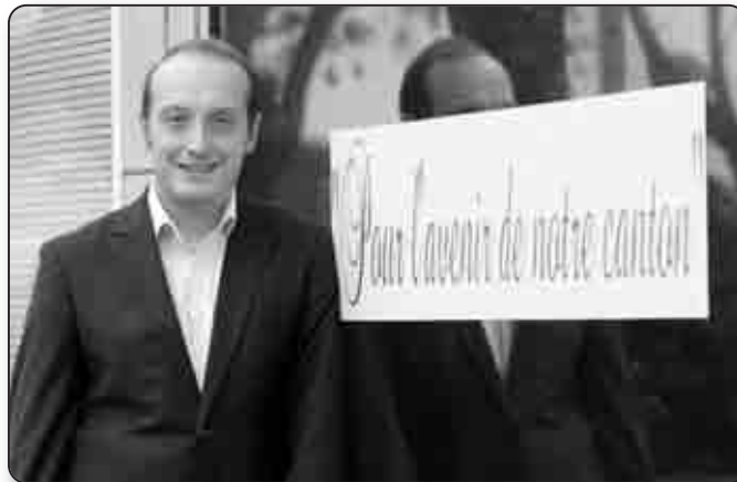
Le jeune Conseiller Général du 1 er canton d'Ajaccio croit à une politique du terrain

Cette commission s'est déjà réunie deux fois et a acté le retour du Département, qui n'y participait plus depuis quatre ans, dans le contrat urbain de cohésion sociale de la Ville d'Ajaccio. Une tel retour me paraissait essentiel. Au-delà, la mission de la commission est de faire en sorte que la Ville obtienne le maximum de dotations. Nous y discutons également des demandes de co-financement faites par cette dernière. Enfin, prenez les 8 millions d'euros débloqués pour le stade de l'ACA. C'est sur des sujets de cette nature que la commission a aussi un rôle à jouer.