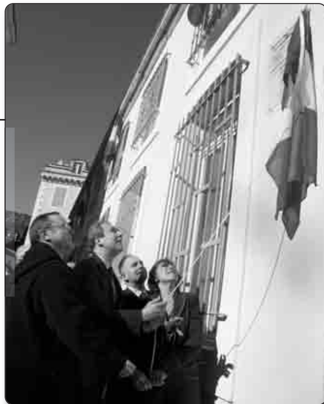
Ci-contre, le Maire de Bastia, bien sûr présent pour accueillir l'ancien premier ministre

En langue corse, nous avons un verbe particulier, «spannà», qui veut dire à la fois dépanner et épanouir et qui s'applique très bien au concept d'École de la 2 ème chance. En effet, pour nous, l'École de la 2 ème chance est une manière d'intervenir sur toutes ces pannes de la vie qui ont laissé nos jeunes concitoyens sur le bord de la route de l'emploi et de l'autonomie sociale. Mais c'est aussi favoriser leur épanouissement en leur faisant prendre conscience des compétences qu'ils ont pour trouver la motivation nécessaire à acquérir celles qui leur manquent afin de réaliser leur projet professionnel.